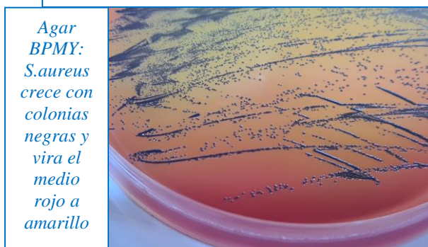
Agar BPMY: S.aureus crece con colonias negras y vira el medio rojo a amarillo

Disolver 60 gramos en 1 litro de agua bidestilada. Agitar calentando hasta ebullición, para la completa disolución. Autoclavar a 121°C durante 15 minutos. Enfriar a 45-50°C y añadir 50 ml/L de Yema de huevo con Telurito Potásico al 3,5% (SBH011). La yema de huevo aumenta la vitalidad y rapidez de crecimiento de los estafilococos. Mezclar y verter en placas. En cosméticos es mejor usar el medio sin yema y con 0,3 mL de solución estéril de Telurito Potásico al 3,5 % (SPL016) por placa, añadido tras autoclavar.